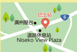
道路休息站 Niseko View Plaza