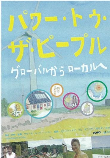
パワー・トゥー・ザ・ピープル ～グローバルからローカルへ～ 再生可能エネルギーの普及が進むオランダやデンマークの、「循環する社会」に向けた挑戦。(49分)

アメリカ全土につくられた7万5千基のダム。「ダム撤去」のため挑戦する人々の姿を追う。(87分)