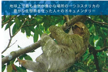
最後の楽園コスタリカ オサ半島の守り人