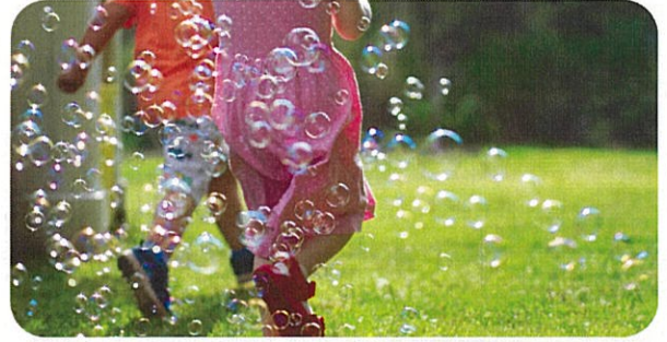
こどものあそびば