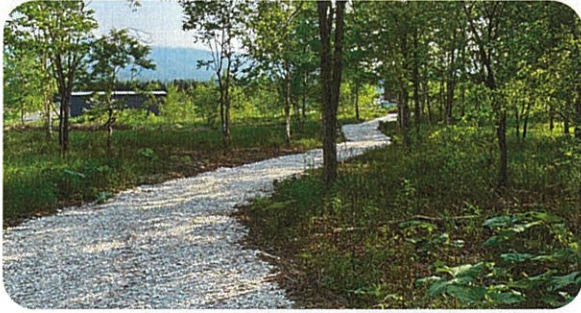
ニセコミライの森へお散歩